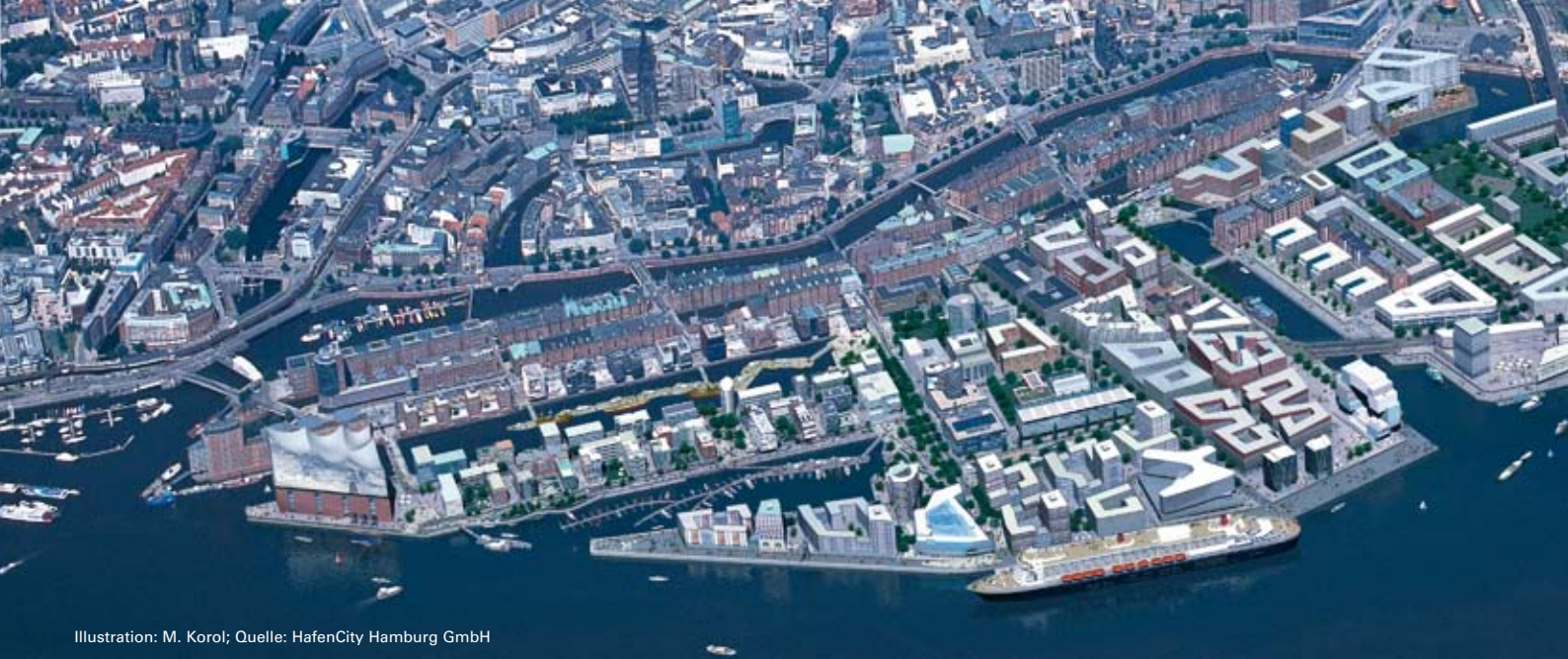
Illustration: M. Korol; Quelle: Hafencity Hamburg GmbH