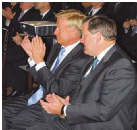
Bürgermeister von Beust applaudierte den Plänen der beiden Partner

Aus Anlass eines Senatsempfangs zum 50-jährigen Jubiläum des BUKH am 8. Mai 2009 im Kaisersaal des Hamburger Rathauses, unterzeichneten der Vorstandsvorsitzende des BUKH, Rainer Prestin, und HSB-Präsident Günter Ploß eine Absichtserklärung für die Kooperation der beiden Organisationen.